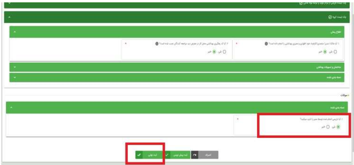
شکل ۴: تایید یا عدم تایید ممیزی

در صورت عدم تأیید ممیزی، با انتخاب گزینه «خیر» برای پرسش فوق، یک دستور بازرسی از واحد مربوطه برای بازرسی ایجاد خواهد شد. در این حالت بازرسی مشابه روال قبل ایجاد و انجام خواهد شد.