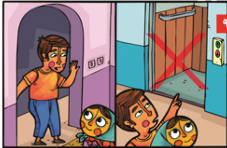
۹ فقط زیر چهارچوب های محکم پناه بگیریم، مثل خانه های قدیمی که چهارچوب بخشی از دیوار است. در زمان زلزله از آسانسور استفاده نکنیم.