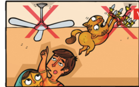
۷ مراقب پنکه سقفی و لوسترها باشیم.