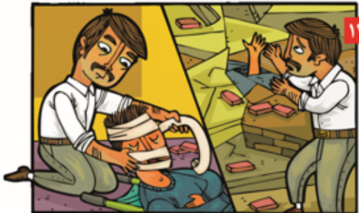
۱۲ راه هوایی مسدوم را باز کرده و محل خونریزی را با دستمال فشار دهیم. اندام ها و گردن را با آتل بی حرکت کنیم. برای جلوگیری از صدمه نخاعی، مسدوم را با احتیاط از زیر آوار بیرون آورده و حمل کنیم.