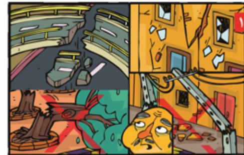
۱۰ اگر در زمان زلزله بیرون از ساختمان هستیم از دیوارها، درخت های بلند، تیر برق و زیر پل ها دوری کنیم.