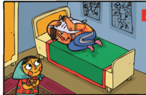
۸ اگر در زمان زلزله خواب هستیم، سرمان را با بالش حفظ کنیم. اما اگر خطرات جسم سنگین یا برنده ای وجود داشت، از آن فاصله می گیریم.