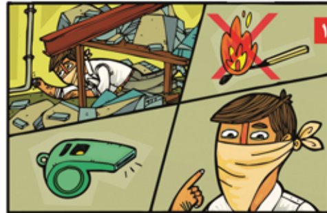
۱۱ اگر زیر آوار گیر کردیم کبریت روشن نکنیم، دمان را با پارچه بپوشانیم، با سنگ و اجسام فلزی زده یا سوت بزنیم. فریاد زدن آخرین کار است.