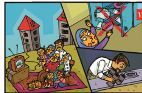
۱۳ بعد از زلزله، کابینت را با احتیاط باز کنیم. سالم بودن لوله بخاری را بررسی کنیم و قبل از برگشت به داخل ساختمان از ایمن بودن آن مطمئن شویم.